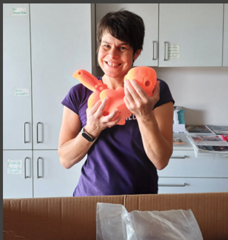
Neue Griffe! Immer eine Freude für Groß und Klein

Dank einer weiteren großzügigen Spende konnten wir uns ein 2. Selbstsicherungsgerät anschaffen. Damit ist mehr Individual-